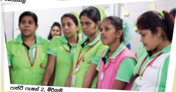
ලාස්ට් ෆැෂන් 2, මීරගම