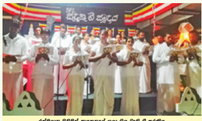
රත්මලාන ලිහිමින් ආයතනයේ ගලා ගිය බැති ගී සරණිය