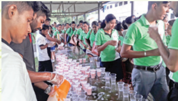
මීරගම ෆාස්ට් ෆැෂන් 2 ආයතන සාමාජිකයින්ගේ ෆුූඩ් දන්සල