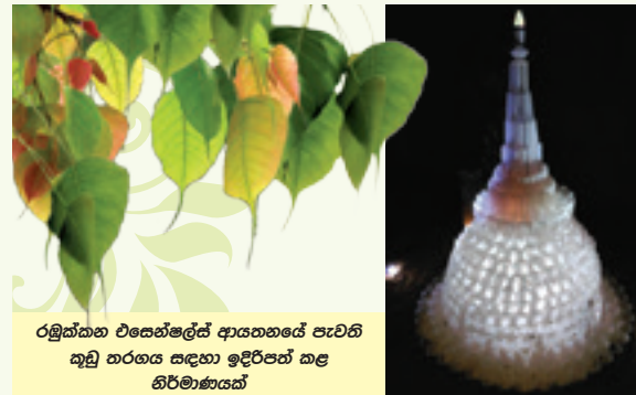
රමුත්තන එසෙන්ඔල්ස් ආයතනයේ පැවති කුඩු තරඟය සඳහා ඉදිරිපත් කළ නිර්මාණයක්