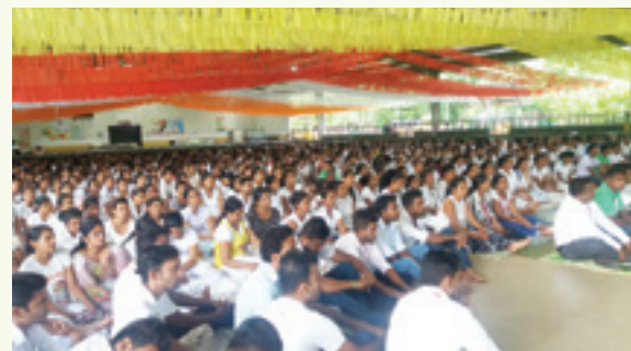
මීරගම ෆාස්ට් ෆැෂන් 1 ආයතනයේ පැවති වෙසක් ධර්මදේශනාවට සහභාගි වූ සාමාජිකයින්