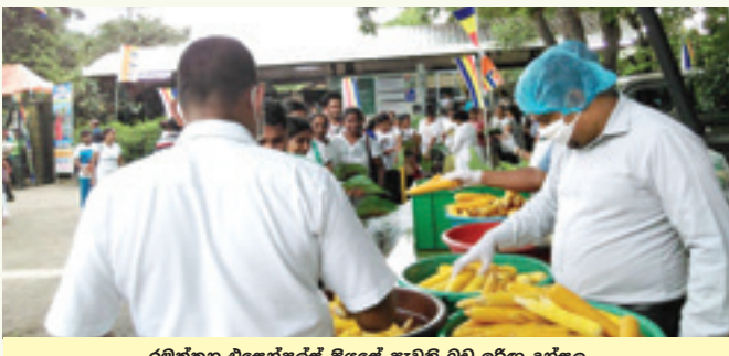
රමුත්තන එසෙන්ඔල්ස් පියසේ පැවති බඩ ඉරිඟු දන්සල