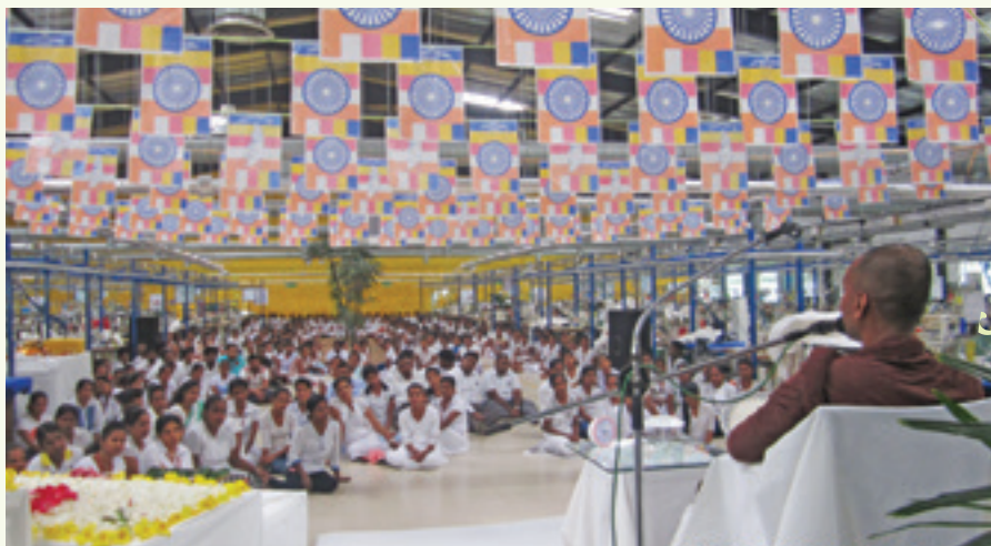
වෙසක් පොහොය නිමිත්තෙන් සිදුවූ හරිත කර්මාන්තශාලාවෙහි පැවති ධර්මදේශනාව අතරතුර