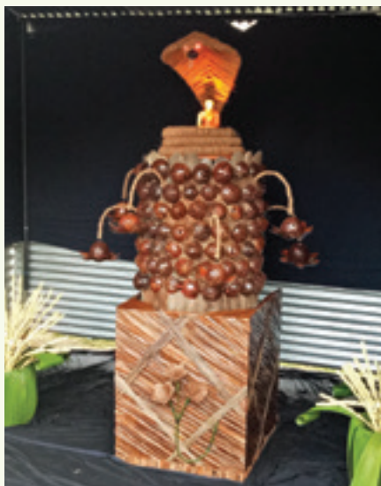
කොන්ගල එසෙන්ඔල්ස් ආයතනයේ පැවති කුඩු තරඟය සඳහා ඉදිරිපත් කළ නිර්මාණාත්මක කුඩුවක්