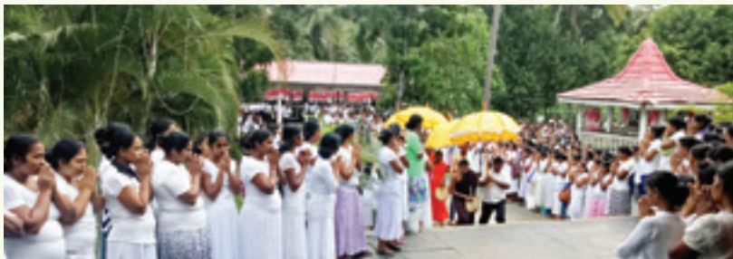
පොසොන් පොහොය වෙනුවෙන් රඳීමම් කැපුවල්වෙසා(ර්) ආයතනයේ පැවති ධර්ම දේශනාවට ස්වාමීන්වහන්සේලා වැඩම කරමින්