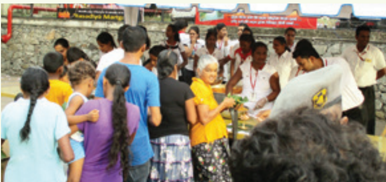
මිනුවන්ගොඩ ෆාස්ට් ෆැෂන් ආයතනයේ පැවති කඩල දන්සල