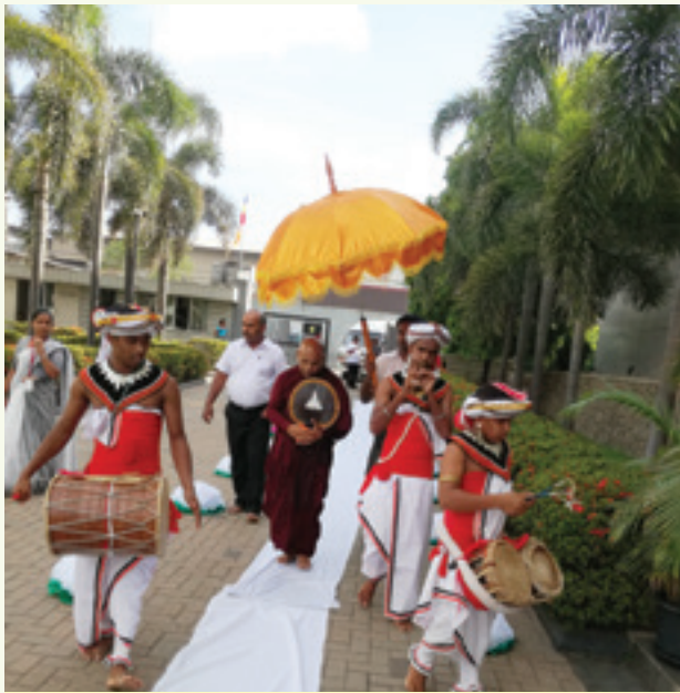
එකල සෙන්ටර් ඔෆ් ඉන්ජිනිවරියන්ස් ආයතනයේ පැවති ධර්මදේශනාව සඳහා ස්වාමීන්වහන්සේ වැඩමකළ මොහොත

වෙසක් සඳ මෙන්ම පොසොන් සඳ බැස ගියත් ඒ උදෙසා අප ආයතන පරිශ්‍රයන් හි සංවිධාන කරන්නට යෙදුණු වෙසක් පොසොන් සැමරුම්වල මතකයන් නම් සදාකාලයටම රැඳේවි. වෙසක් සහ පොසොන් පොහොය මූලික කරගනිමින් අප ආයතනයන් විවිධාකාරයේ පින්කම් සංවිධානය කර තිබුණු අතර කැමරා කාචයේ සටහන් වුණු එවන් සොඳුරු සැමරුම් කිහිපයක සේයාවන් වියමන් මගින් ඔබ වෙත ගෙන එන්න අපි හිතුවා.