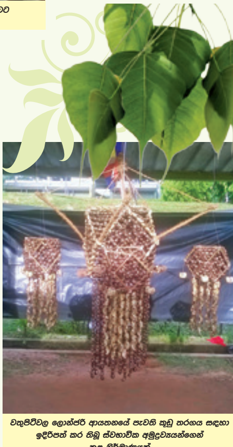
වතුපිටිවල ලොන්ජර් ආයතනයේ පැවති කුඩු තරඟය සඳහා ඉදිරිපත් කර තිබූ ස්වභාවික අමුද්‍රව්‍යයන්ගෙන් කළ නිර්මාණයක්