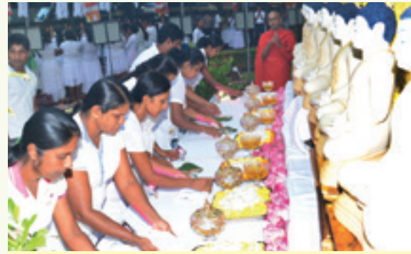
වෙසක් පොහොය හිමිත්තෙන් පොළොන්නරුව ඇත්ලොෂර් ආයතනයේ පැවති සත් මුදු වන්දනා වැඩසටහනේ එක් අවස්ථාවක්