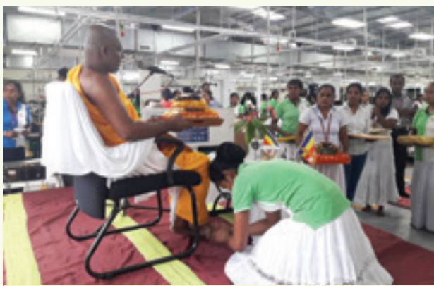
වැලිසර ෆාස්ට් ෆැෂන් ආයතනයේ වෙසක් පොහොය වෙනුවෙන් පැවති වැඩසටහනේ මාලාවේ එක් අවස්ථාවක්