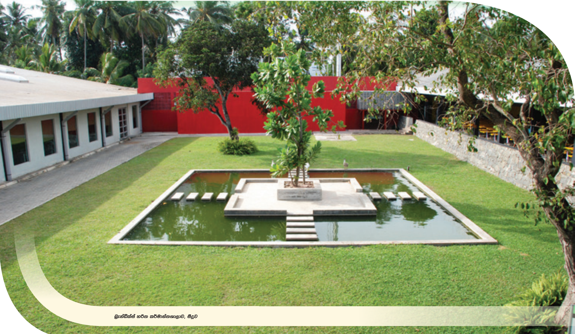
මුැන්ඩික්ස් හරිත කර්මාන්තශාලාව, සිදුව

ජාත්‍යන්තර පරිසර දිනය යෙදී තිබුණේ පසුගිය ජුනි 5 වැනිදාට. ලොව පුරා විවිධාකාරයෙන් පරිසර දිනය සැමරුවත් මුැන්ඩික්ස් අපට නම් වසරේ සෑම දිනයක්ම පරිසර දිනයක් වගෙයි. ඒ අපි කොඩාදහම සමඟින් ඔද්ධ වුණු ආයතනයක් වන නිසයි. අපගේ ආයතන සමූහය තුළ ක්‍රියාත්මක වන හරිත සංකල්පය එයට හොඳින් සාක්ෂි දරනවා. මේ වසරේ ලෝක පරිසර දින තේමාව වූයේ, "කොඩාදහම සමඟින් එක්ව යමු" යන්නයි. පරිසරය සමඟ ඔැඳි සිටින ආයතනයක් ලෙසින් මුැන්ඩික්ස් අපට නම් එය මනාව ගැලපෙනවා.