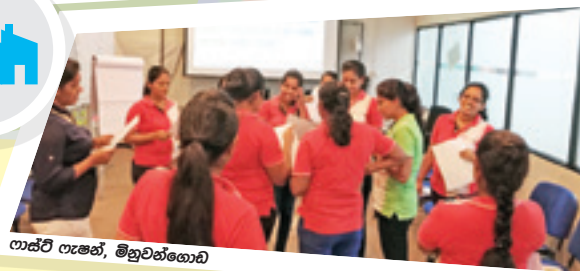
ලාස්ට් ෆැෂන්, මිහුච්චෝඩ