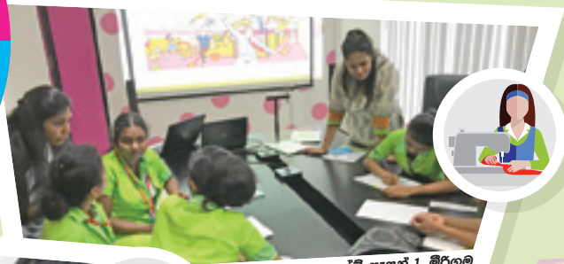
ලාස්ට් ෆැෂන් 1, මීරගම