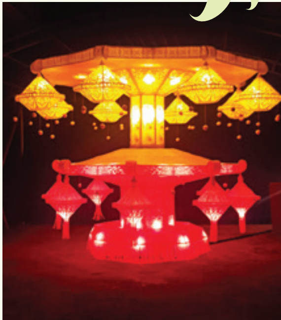
පන්නල ටෙක්ස්ටයිල් ආයතනය අලංකාරවත් කළ සුන්දර වෙසක් සැරසිල්ලක්