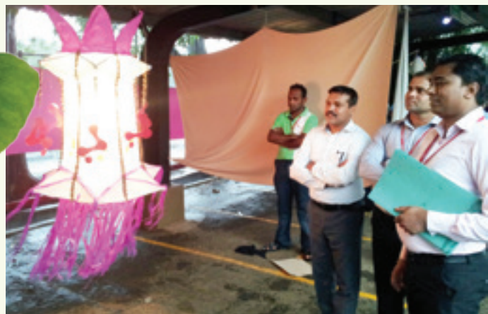
තිව්තිගල එසෙන්ඔල්ස් ආයතනයේ පැවති කුඩු තරඟයේ විනිශ්චය කටයුතු අතරතුර